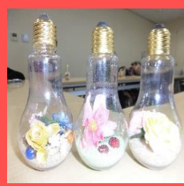
今月のフラワーは雑貨作りをしました。