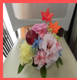
今月の手芸・工作はフラワーアレンジでした。