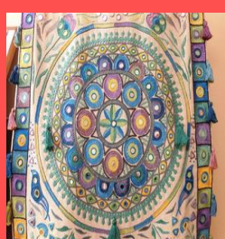
利用者様K様の作品、お部屋に飾ってます。すごい大作ですね！