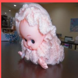
利用者様H様の作品、可愛いです♡