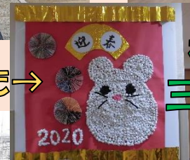
初詣 三田天満神社