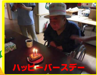
ハッピーバースデー