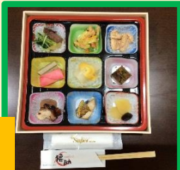
福助グループからお弁当のプレゼント