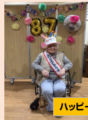
ハッピーバースデー

世界唯一のNCCテクノロジー【異種光触媒技術】で空気中の各種ウイルス・各細菌類を 99%以上減少 ウイルス対策・除菌 脱臭・除臭・消臭