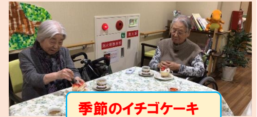
季節のイチゴケーキ

3月にお二人が100歳を迎えられました 盛大にお祝いをしました。 ずっとお元気でいて下さいね